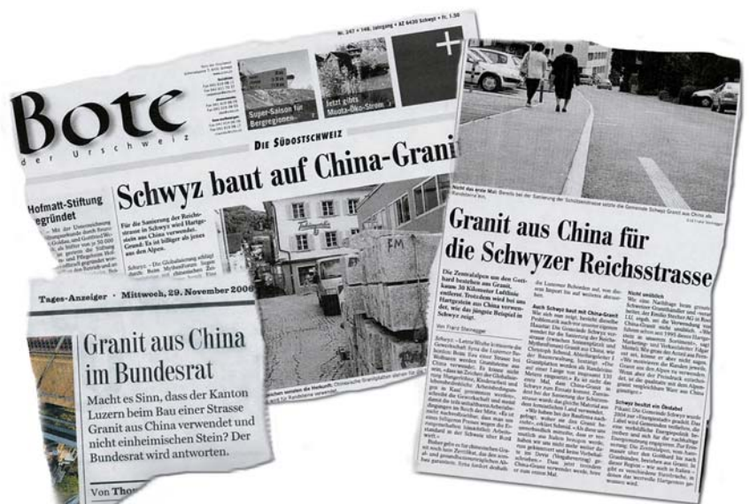
Auch die Presse greift den Import von Steinen kritisch auf.

Nicht nur beim Granit lohnt sich das Überdenken der Situation. Auch die Versorgung mit qualitativ erstklassigem Hartgestein für unsere hoch beanspruchten Verkehrswege sollte so weit wie möglich im eigenen Land gesichert sein: Die Schweiz benötigt pro Jahr mehr als 2 Mio. Tonnen Hartgestein der höchsten Qualität, da-