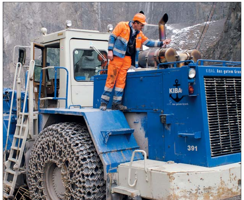
Starke Maschinen brauchen starke Männer: Zeno Betschart an der Arbeit.

Erfolgreiche Betriebskontrolle im Zingel durch den Fachverband FSKB: