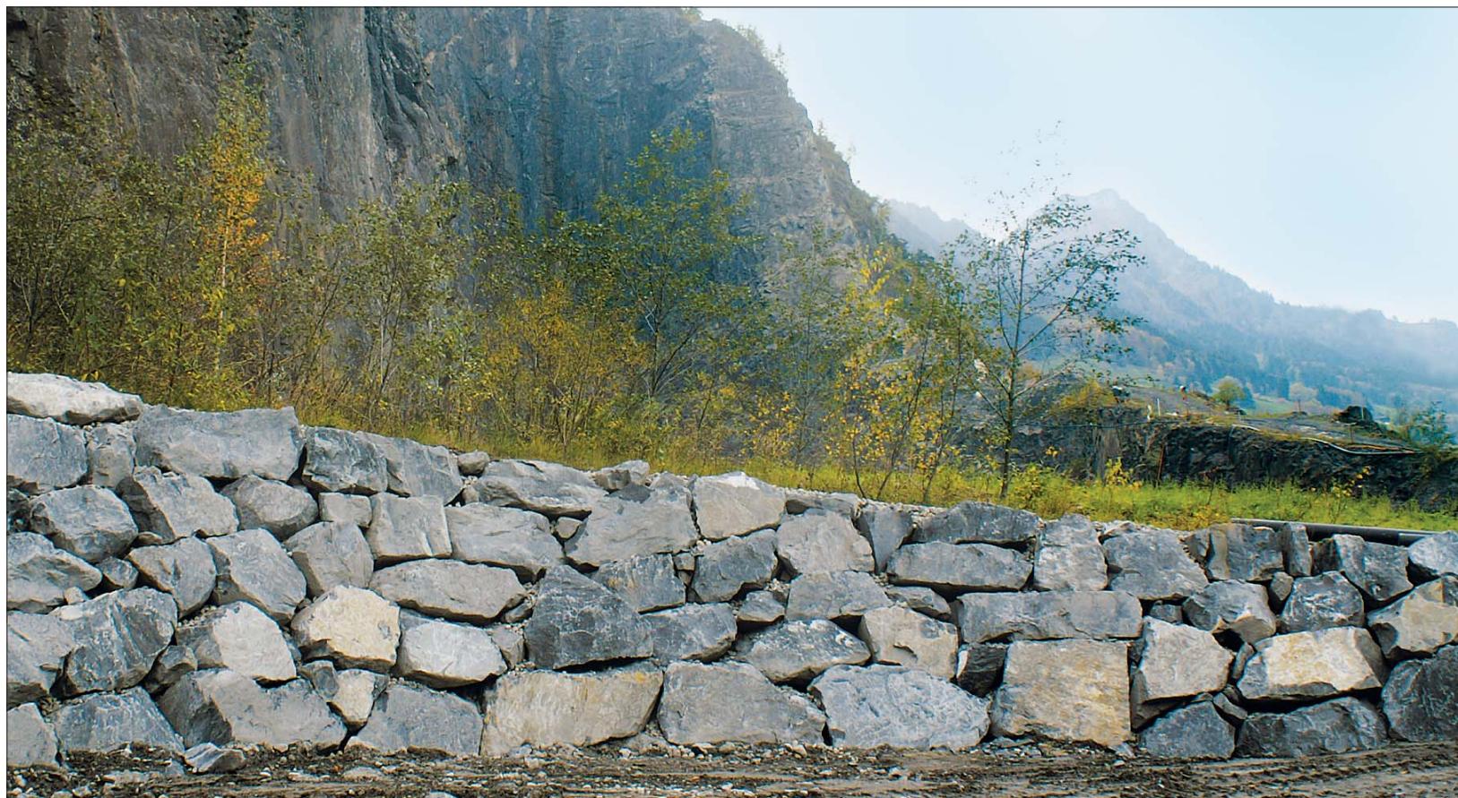
Renaturierung des Steinbruchs: Hinter dem mächtigen Blocksatz wird die Natur rasch gedeihen.

Ironie des Schicksals: Die Beschwerde der Berner Umweltbehörde droht, ausgerechnet die erfolgreich begonnene Renaturierung im Zingel zu verzögern. Wenn nämlich zu wenig Abraummateriale zur Verfügung steht, weil man die Hartsteingewinnung aufgeben muss, kommt auch die Rekultivierung ins Stocken.